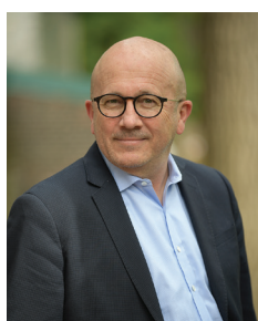
Brice Charlier Construction Demathieu & Bard (CDB) inc.