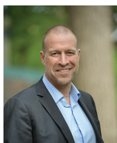
Jean François Dufour Béton Provincial LTÉE