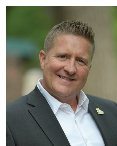
François Vallières Armatures Bois-Francis inc.