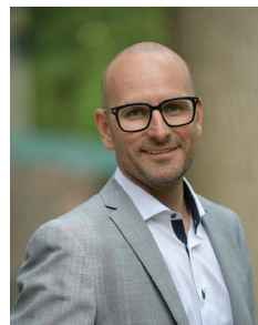
Denis Boucher LA Hébert Ltée