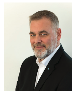
Marc-André Roger Liebherr Canada Ltée.

SIÈGE SOCIAL 435, Grande Allée Est, Québec (Québec) G1R 2J5