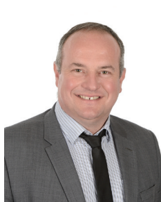
Michaël Flaviano Sintra inc