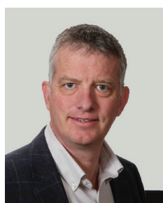
Louis St-Arnaud Construction Arno inc.