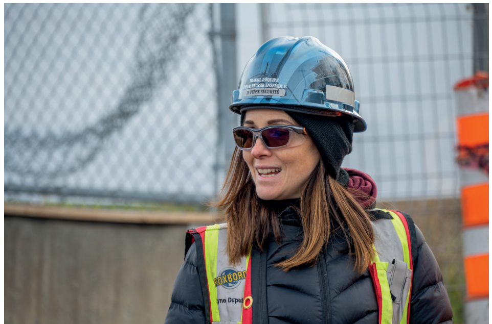
Gagnant du Prix Reconnaissance-mixité 2022.