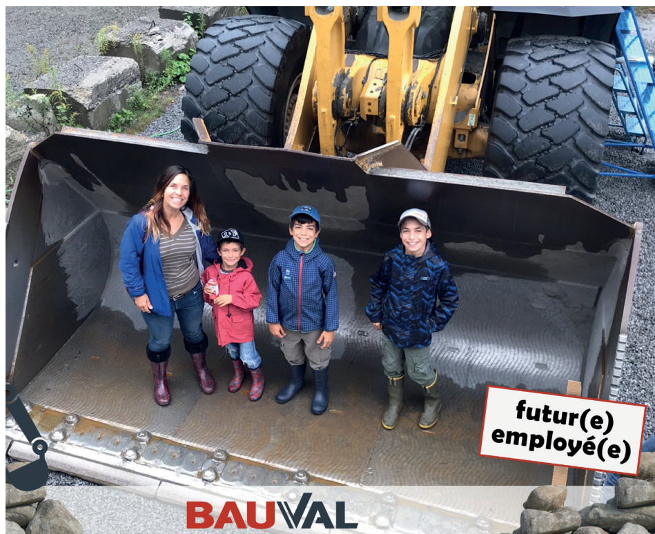
Édition 2019 de « Visite ta carrière » chez Bauval