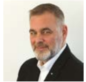
Marc-André Roger LIEBHERR CANADA LTÉE