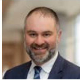
M e Yannick Forget MILLER THOMSON S.E.N.C.R.L.