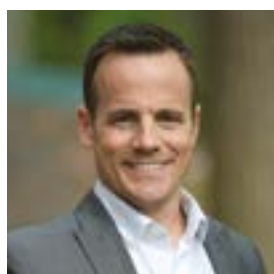
Éric Labonté POMERLEAU INC.